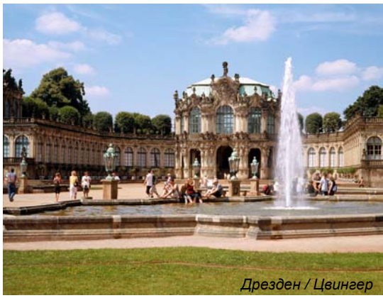
Дрезден / Цвингер