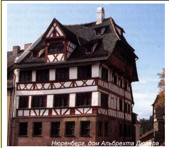
Нюрнберг, дом Альбрехта Дюрера