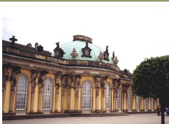
Потсдам, дворец Санссуси