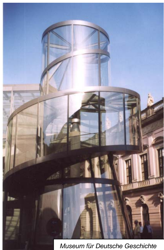
Museum für Deutsche Geschichte