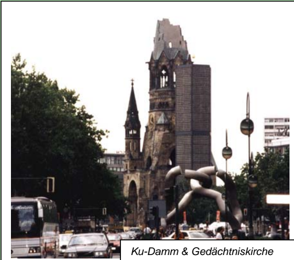
Ku-Damm & Gedächtniskirche