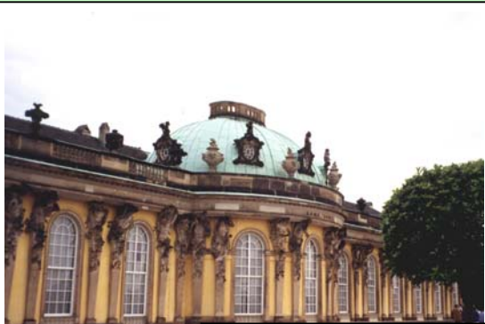
Potsdam -Schloss Sanssouci

Besichtigen Sie die Sehenswürdigkeiten und erholen Sie sich in der wunderschönen Natur Berlins.