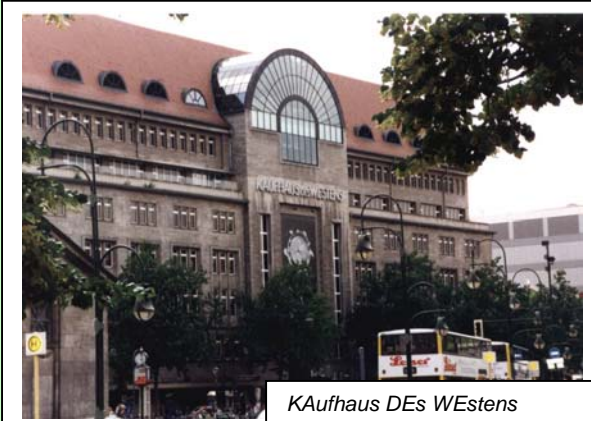
KAufhaus DEs WEstens